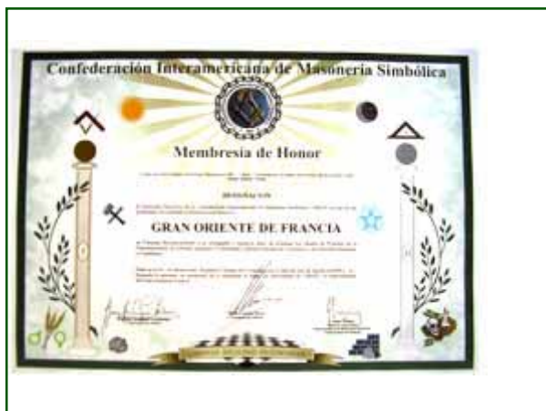
Imagen: Reconocimiento hecho por la Confederación Interamericana de la Masonería Simbólica, CIMAS, al Gran Oriente de Francia al ser reconocido como miembro honorario.