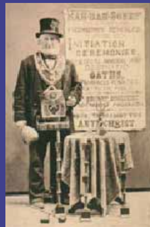
Hermoso grabado de un antiguo mason, con sus atuendes de epoca.

Hiram Abif más que un mito o leyenda, es un paradigma de genialidad, perseverancia, racionalidad y humanismo, que debería ser un ejemplo a seguir, no una exaltación al mito o leyenda, ni culto a la personalidad.